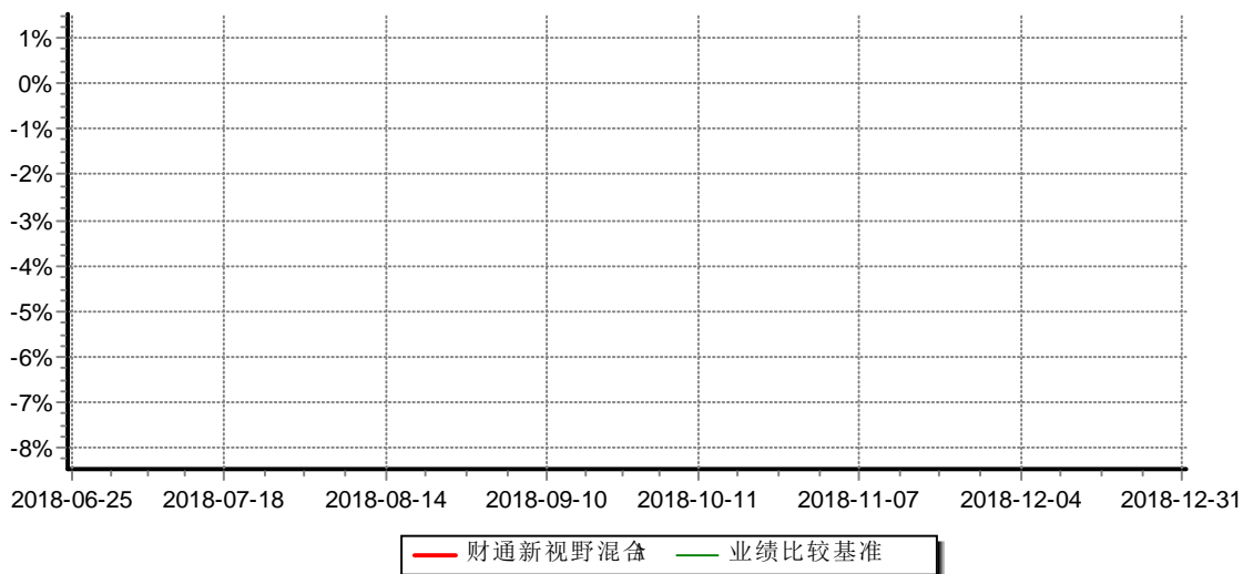
财通新视野灵活配置混合型证券投资基金C 累计净值增长率与业绩比较基准收益率历史走势对比图 (2018年06月25日-2018年12月31日)