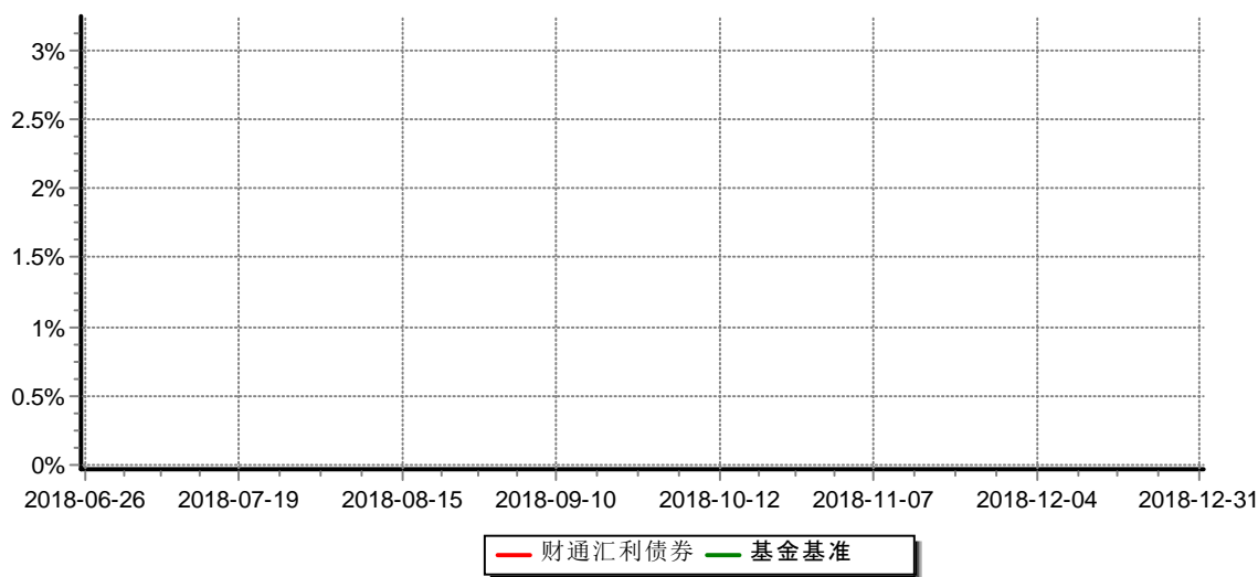
财通汇利纯债债券型证券投资基金 累计净值增长率与业绩比较基准收益率历史走势对比图 （2018年6月26日-2018年12月31日）

注：(1)本基金合同生效日为2018年6月26日，基金合同生效起至披露时点不满一年；