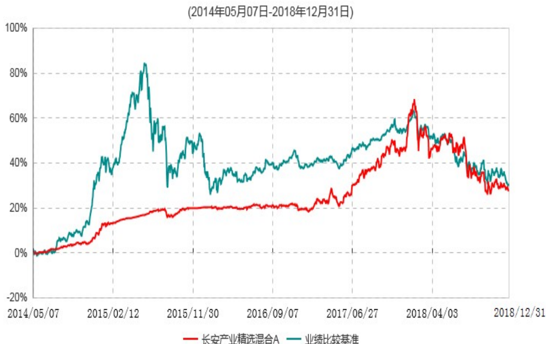
长安产业精选混合A累计净值增长率与业绩比较基准收益率历史走势对比图

本基金合同生效日为 2014 年 5 月 7 日，基金合同生效日至报告期期末，本基金运作时间超过一年。根据基金合同的规定，自基金合同生效之日起 6 个月内基金各项资产配置比例需符合基金合同要求。本基金在建仓期结束后，各项资产配置比例已符合基金合同有关投资比例的约定。图示日期为 2014 年 5 月 7 日至 2018 年 12 月 31 日。