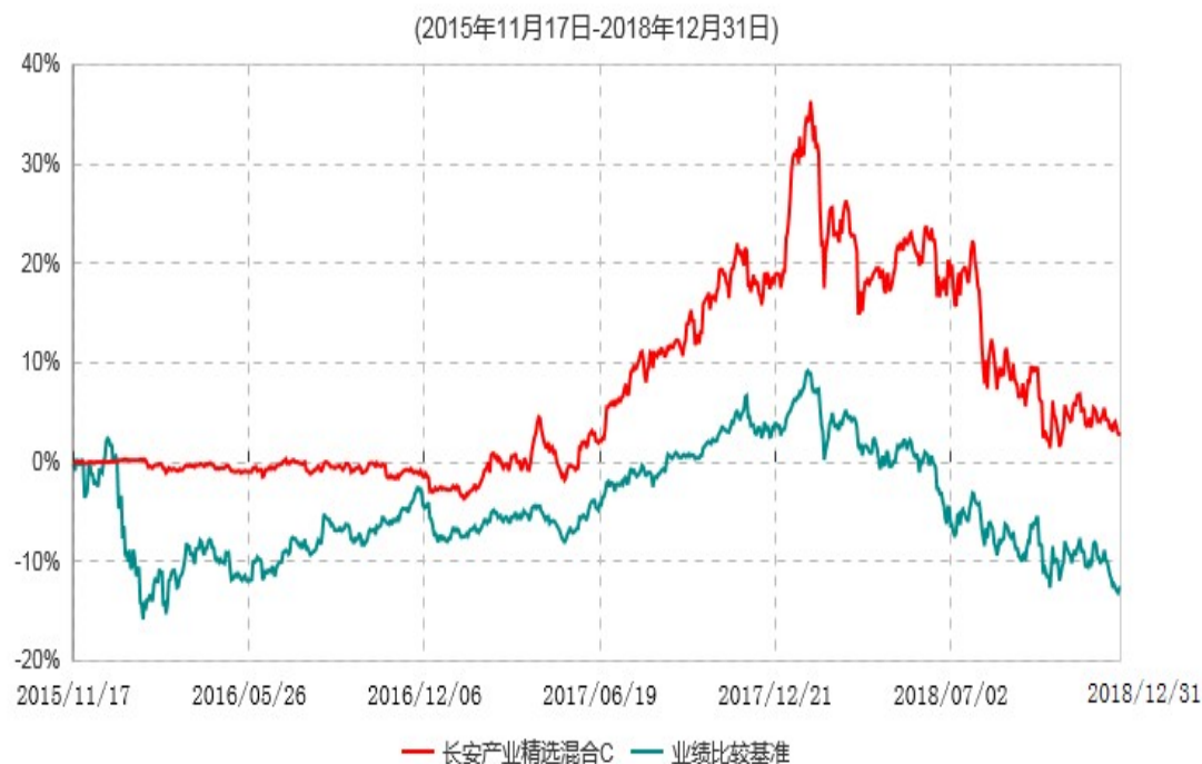
长安产业精选混合C累计净值增长率与业绩比较基准收益率历史走势对比图

本基金合同生效日为 2014 年 5 月 7 日，基金合同生效日至报告期期末，本基金运作时间超过一年。根据基金合同的规定，自基金合同生效之日起 6 个月内基金各项资产配置比例需符合基金合同要求。本基金在建仓期结束后，各项资产配置比例已符合基金合同有关投资比例的约定。图示日期为 2014 年 5 月 7 日至 2018 年 12 月 31 日。