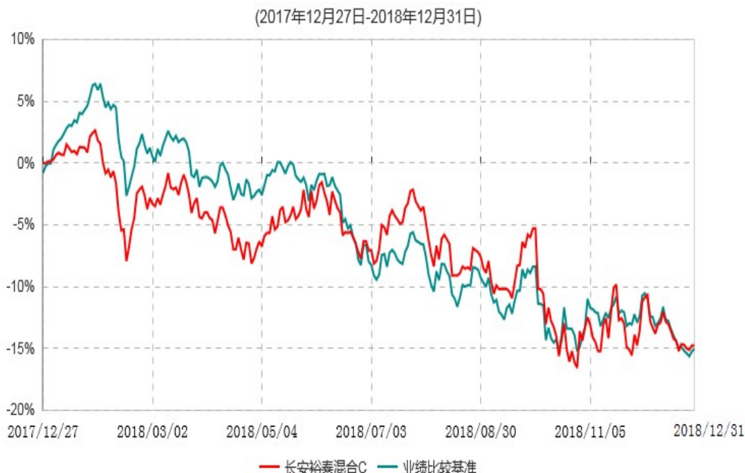
长安裕泰混合C累计净值增长率与业绩比较基准收益率历史走势对比图

根据基金合同的规定,自基金合同生效之日起 6 个月内基金各项资产配置比例需符合基金合同要求。本基金在建仓期结束后,各项资产配置比例已符合基金合同有关投资比例的约定。基金合同生效日至报告期期末,本基金运作时间超过一年。图示日期为 2017 年 12 月 27 日至 2018 年 12 月 31 日。