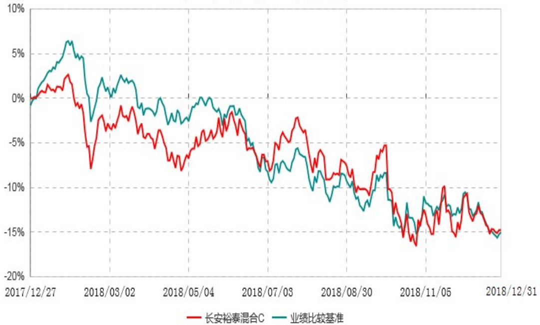
长安裕泰混合C累计净值增长率与业绩比较基准收益率历史走势对比图 (2017年12月27日-2018年12月31日)

根据基金合同的规定,自基金合同生效之日起 6 个月内基金各项资产配置比例需符合基金合同要求。本基金在建仓期结束后,各项资产配置比例已符合基金合同有关投资比例的约定。基金合同生效日至报告期期末,本基金运作时间超过一年。图示日期为 2017 年 12 月 27 日至 2018 年 12 月 31 日。