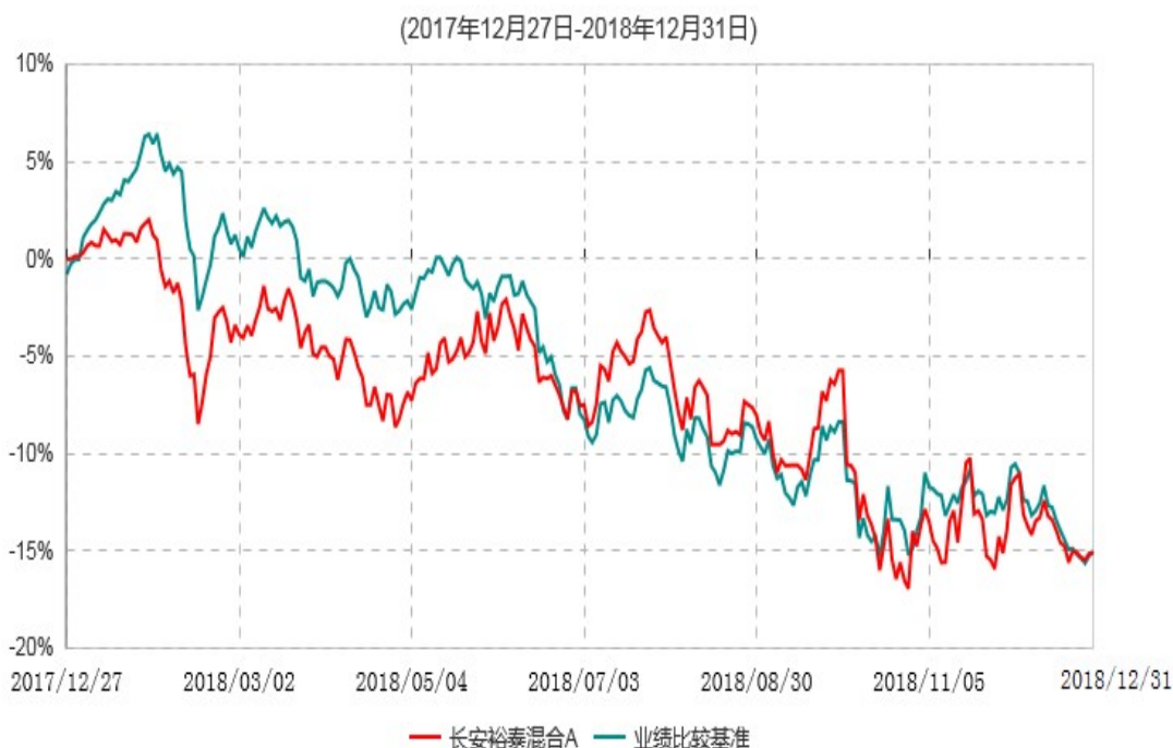
长安裕泰混合A累计净值增长率与业绩比较基准收益率历史走势对比图

根据基金合同的规定,自基金合同生效之日起 6 个月内基金各项资产配置比例需符合基金合同要求。本基金在建仓期结束后,各项资产配置比例已符合基金合同有关投资比例的约定。基金合同生效日至报告期期末,本基金运作时间超过一年。图示日期为 2017 年 12 月 27 日至 2018 年 12 月 31 日。