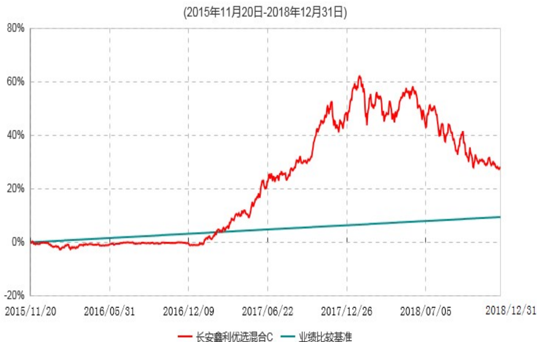
长安鑫利优选混合C累计净值增长率与业绩比较基准收益率历史走势对比图

长安鑫利优选混合 C 于 2015 年 11 月 17 日公告新增，实际首笔 C 类份额申购申请于 2015 年 11 月 20 日确认，图示日期为 2015 年 11 月 20 日至 2018 年 12 月 31 日。