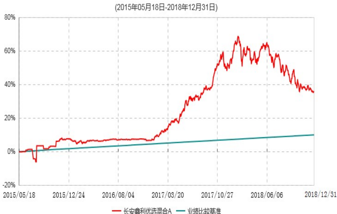
长安鑫利优选混合A累计净值增长率与业绩比较基准收益率历史走势对比图

本基金基金合同生效日为 2015 年 5 月 18 日，按基金合同规定，本基金自基金合同生效起 6 个月为建仓期，截止到建仓期结束时，本基金的各项投资组合比例已符合基金合同的相关规定。图示日期为 2015 年 5 月 18 日至 2018 年 12 月 31 日。