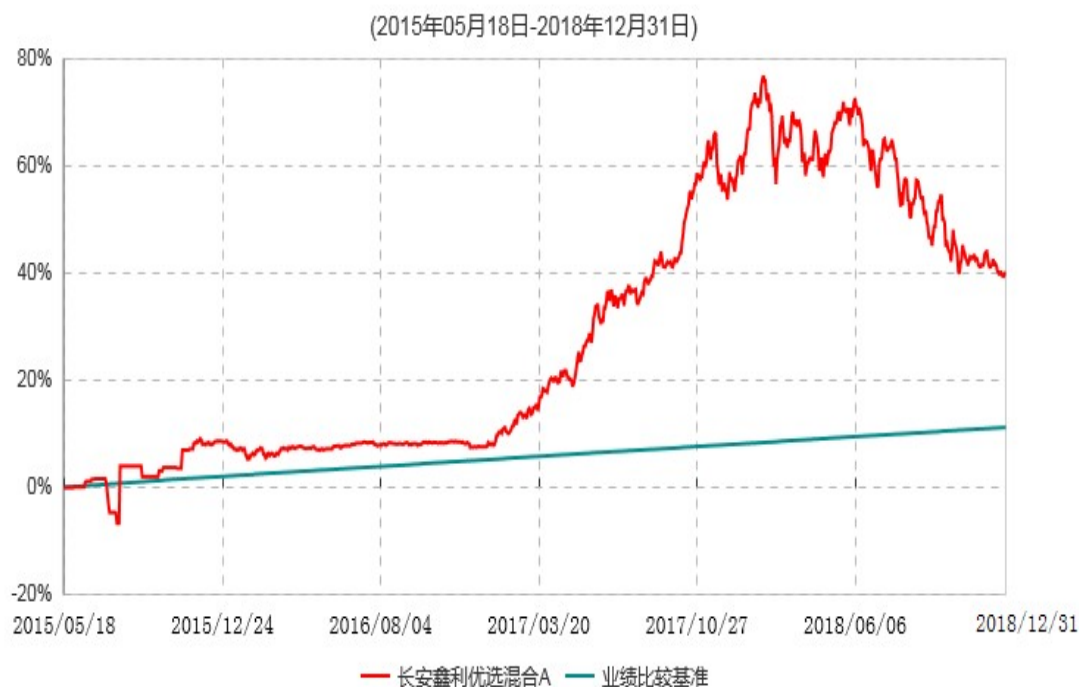
长安鑫利优选混合A累计净值增长率与业绩比较基准收益率历史走势对比图