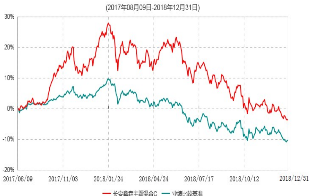
长安鑫益主题混合C累计净值增长率与业绩比较基准收益率历史走势对比图

根据基金合同的规定,自基金合同生效之日起 6 个月内基金各项资产配置比例需符合基金合同要求。本基金在建仓期结束后,各项资产配置比例已符合基金合同有关投资比例的约定。基金合同生效日至报告期期末,本基金运作时间已满一年。图示日期为 2017 年 8 月 9 日至 2018 年 12 月 31 日。