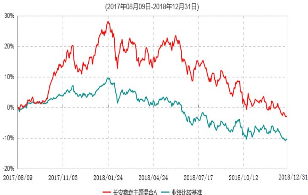
长安鑫鑫主题混合A累计净值增长率与业绩比较基准收益率历史走势对比图

根据基金合同的规定,自基金合同生效之日起6个月内基金各项资产配置比例需符合基金合同要求。本基金在建仓期结束后,各项资产配置比例已符合基金合同有关投资比例的约定。基金合同生效日至报告期末,本基金运作时间已满一年。图示日期为2017年8月9日至2018年12月31日。