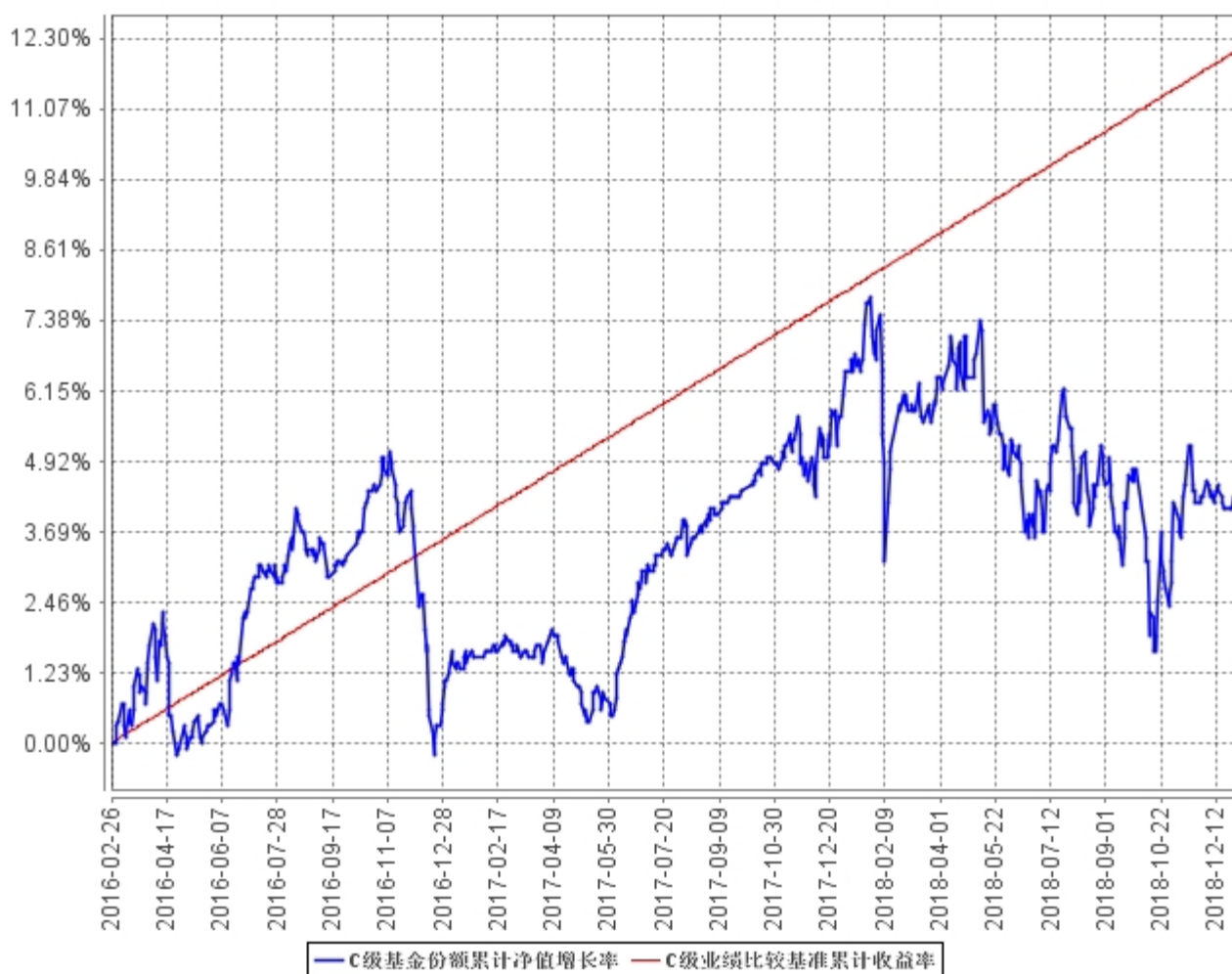
C级基金份额累计净值增长率与同期业绩比较基准收益率的历史走势对比图