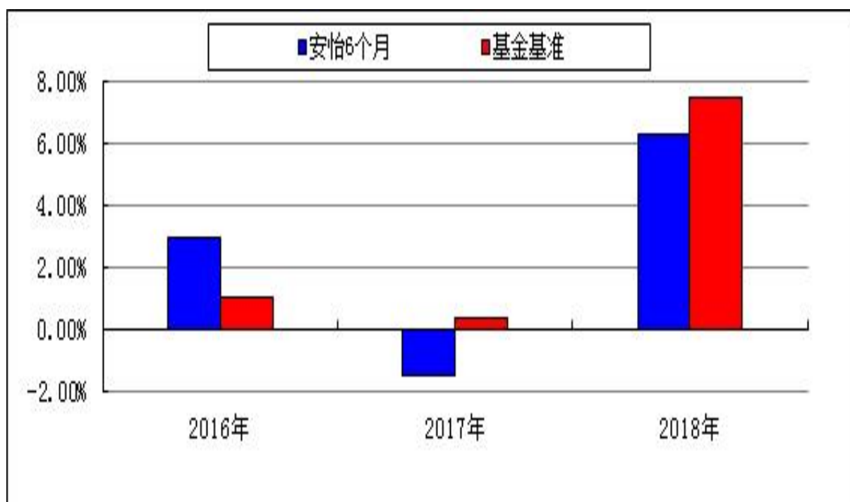
自基金合同生效以来基金净值增长率与业绩比较基准收益率的对比图

注：本基金的基金合同于 2016 年 4 月 15 日生效，合同生效当年按实际存续期计算，不按整个自然年度进行折算。