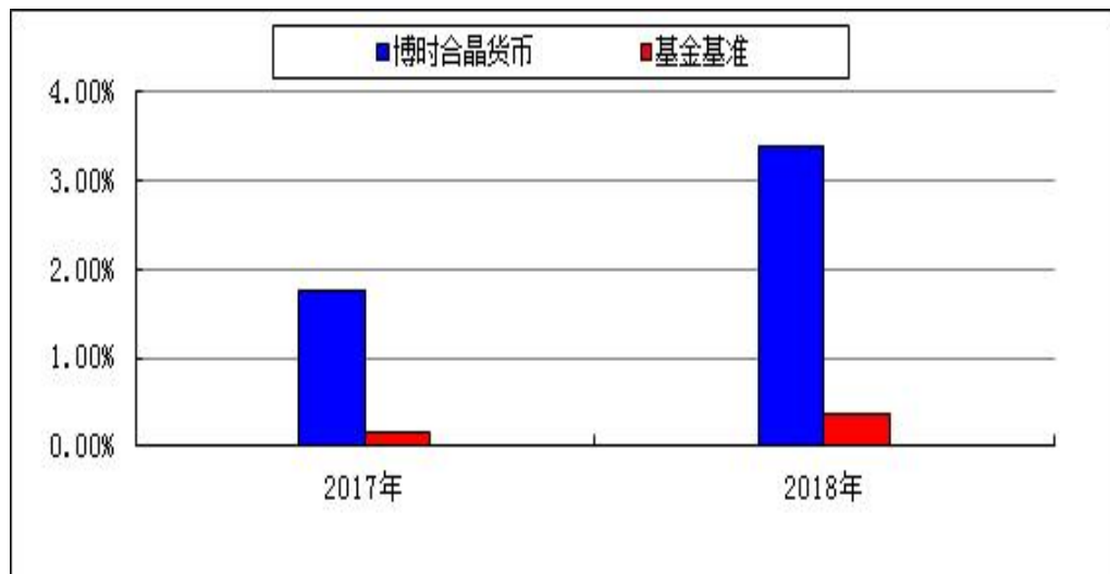
自基金合同生效以来基金净值收益率与业绩比较基准收益率的对比图

注：本基金合同于 2017 年 8 月 2 日生效，合同生效当年按实际存续期计算，不按整个自然年度进行折算。