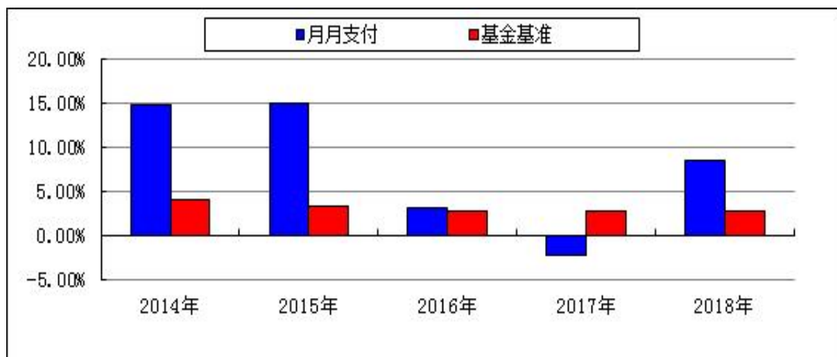
过去五年基金净值增长率与业绩比较基准收益率的对比图