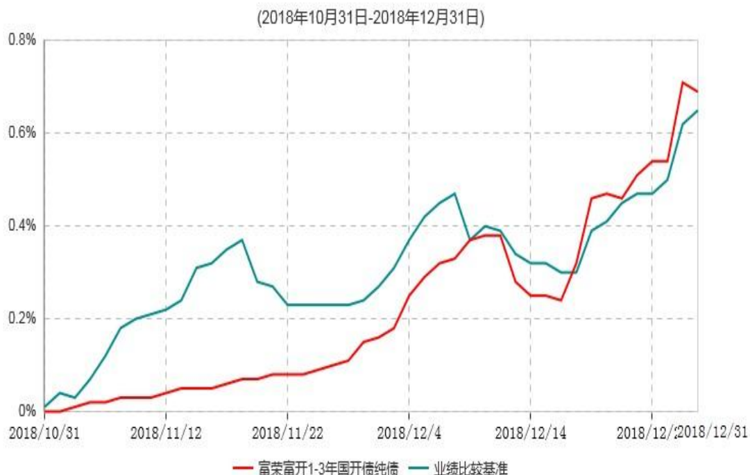
富荣富开1-3年国开债纯债债券型证券投资基金累计净值增长率与业绩比较基准收益率历史走势对比图

注：①本基金基金合同于2018年10月31日生效，截止2018年12月31日止，本基金成立未满一年；