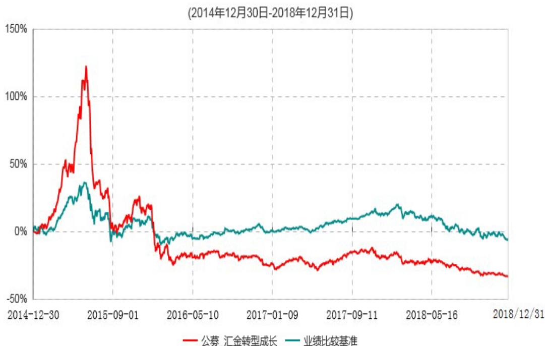
浙商汇金转型成长混合型证券投资基金累计净值增长率与业绩比较基准收益率历史走势对比图