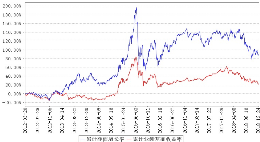
大成新锐产业混合累计净值增长率与同期业绩比较基准收益率的历史走势对比图

注:本基金合同规定,基金管理人应当自基金合同生效之日起六个月内使基金的投资组合比例符合基金合同的约定。建仓期结束时,本基金的投资组合比例符合基金合同的约定。