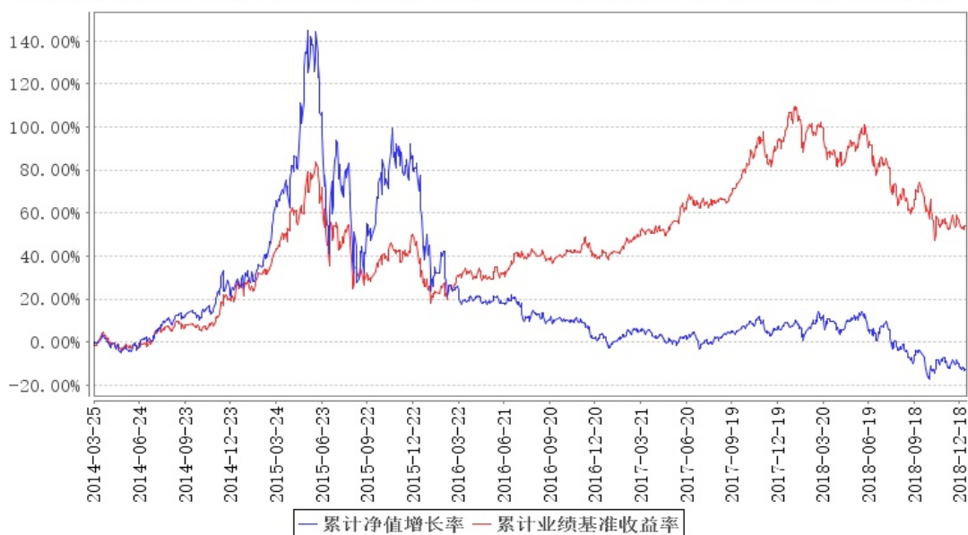
大成消费主题混合累计净值增长率与同期业绩比较基准收益率的历史走势对比图

注:1、按《大成消费主题股票型证券投资基金基金合同》规定,基金管理人应当自2014年3月25日(基金合同生效日)起六个月内使基金的投资组合比例符合基金合同的约定。建仓期结束时,本基金的投资组合比例符合基金合同的约定。