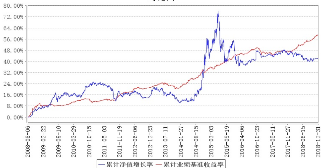
大成强化收益定期开放债券累计净值增长率与同期业绩比较基准收益率的历史走势对比图

注：1. 本基金合同规定，基金管理人应当自基金合同生效之日起六个月内使基金的投资组合比例符合基金合同的约定。建仓期结束时，本基金的投资组合比例符合基金合同的约定。