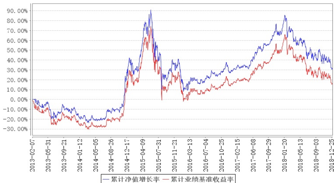
大成中证100ETF累计净值增长率与同期业绩比较基准收益率的历史走势对比图

注:本基金合同规定,基金管理人应当自基金合同生效之日起六个月内使基金的投资组合比例符合基金合同的有关约定。建仓期结束时,本基金的投资组合比例符合基金合同的约定。