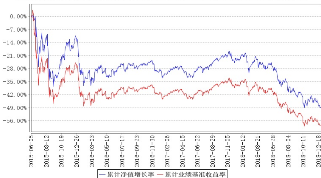
大成深证ETF累计净值增长率与同期业绩比较基准收益率的历史走势对比图

注：本基金合同规定，基金管理人应当自基金合同生效之日起六个月内使基金的投资组合比例符合基金合同的有关约定。建仓期结束时，本基金的投资组合比例符合基金合同的约定。