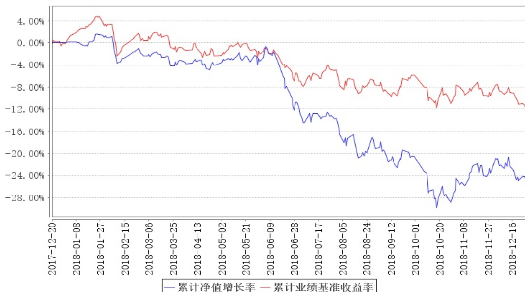
大成盛世精选混合累计净值增长率与同期业绩比较基准收益率的历史走势对比图

注：本基金合同规定，基金管理人应当自基金合同生效之日起六个月内使基金的投资组合比例符合基金合同的约定。建仓期结束时，本基金的投资组合比例符合基金合同的约定。