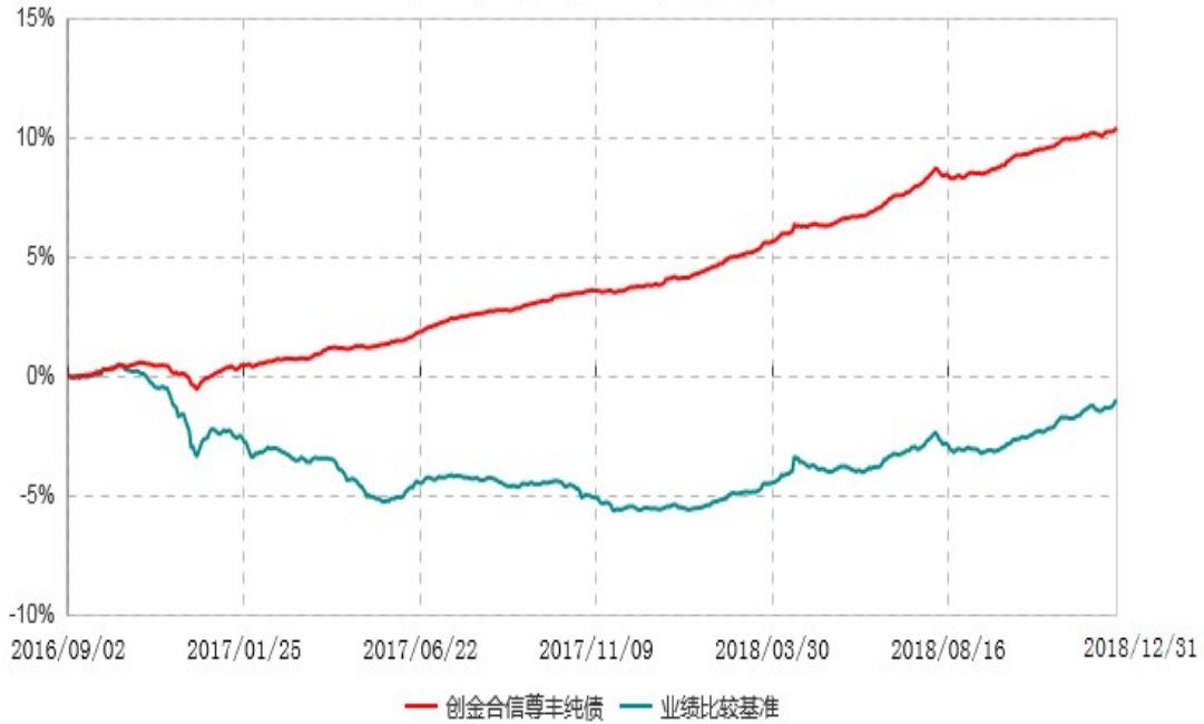
创金合信尊享纯债债券型证券投资基金累计净值增长率与业绩比较基准收益率历史走势对比图 (2016年09月02日-2018年12月31日)