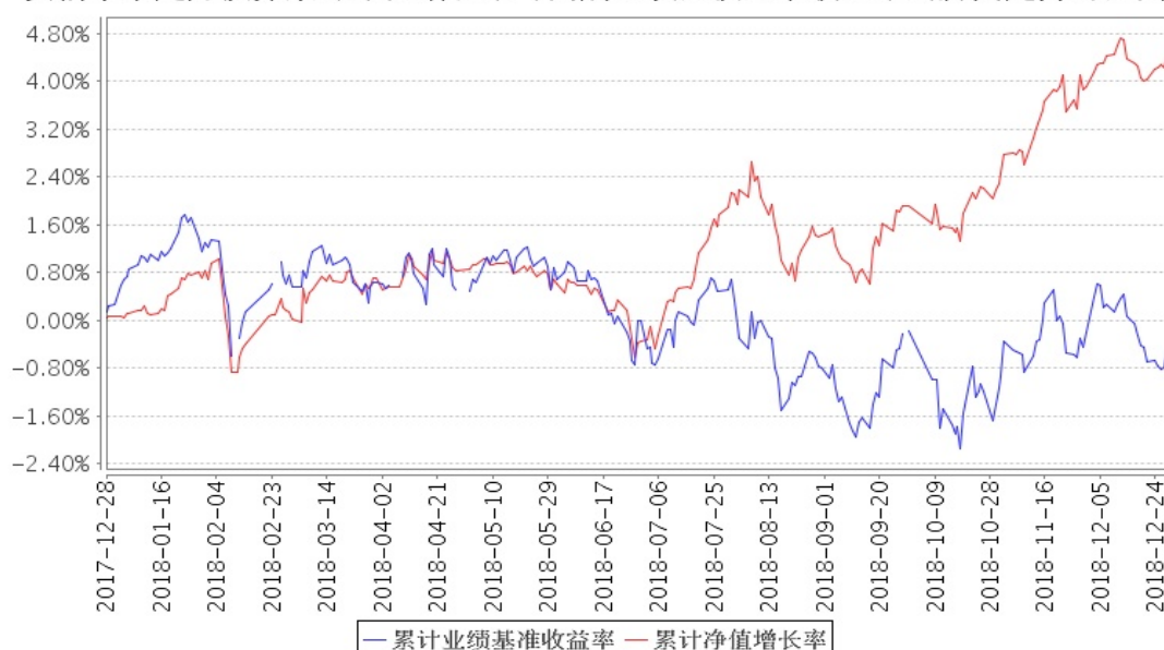
安信永泰定开债券累计净值增长率与同期业绩比较基准收益率的历史走势对比图