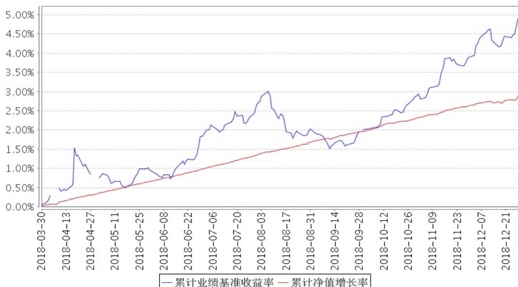
安信永盛定开债券累计净值增长率与同期业绩比较基准收益率的历史走势对比图

注:1、本基金合同生效日为 2018 年 3 月 30 日,截至报告期末本基金合同生效未满一年。