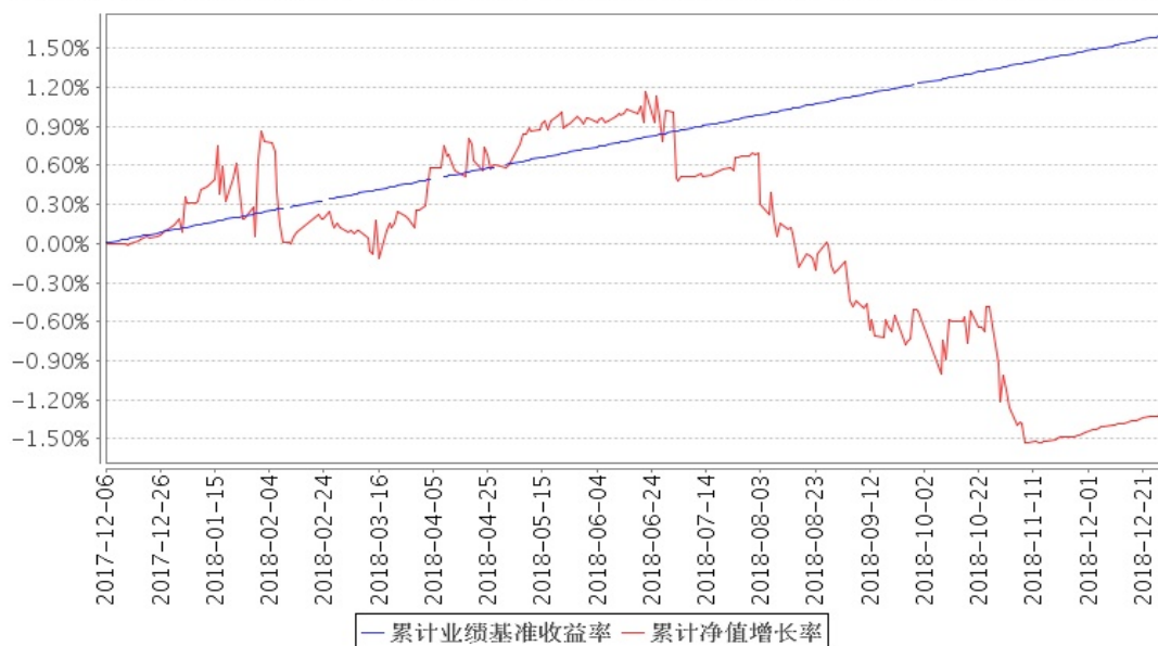
安信阿尔法定开混合累计净值增长率与同期业绩比较基准收益率的历史走势对比图