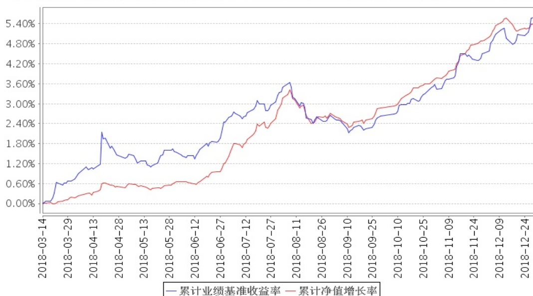
安信尊享添益债券累计净值增长率与同期业绩比较基准收益率的历史走势对比图

注：1、本基金合同生效日为 2018 年 3 月 14 日，截至报告期末本基金合同生效未满一年。