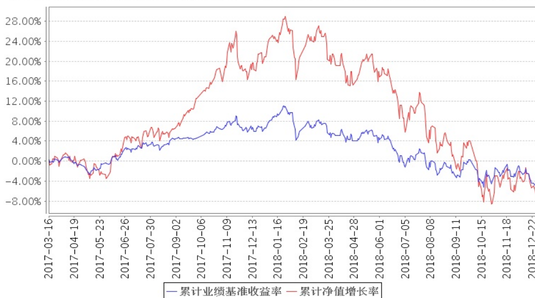
安信中国制造混合累计净值增长率与同期业绩比较基准收益率的历史走势对比图