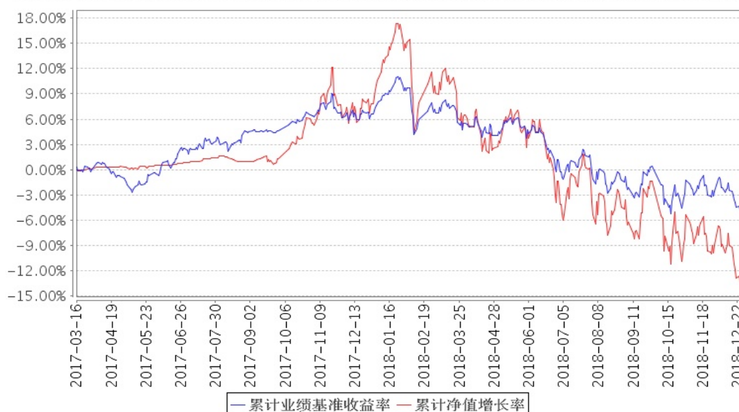
安信新起点混合A累计净值增长率与同期业绩比较基准收益率的历史走势对比图