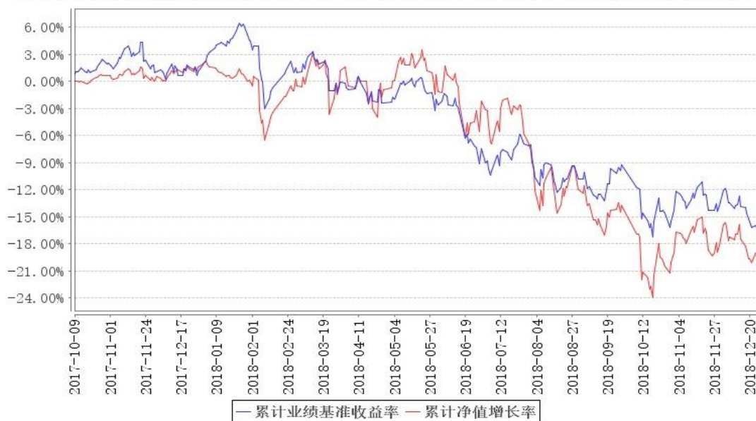
鹏华研究精选混合累计净值增长率与同期业绩比较基准收益率的历史走势对比图