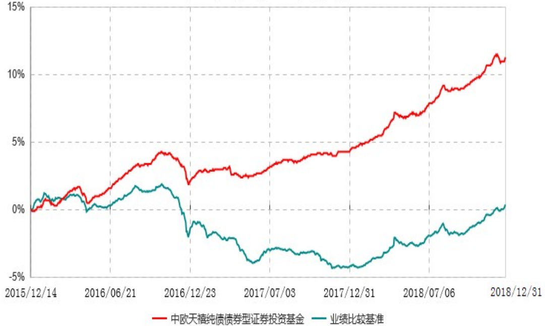
中欧天禧纯债债券型证券投资基金累计净值增长率与业绩比较基准收益率历史走势对比图 (2015年12月14日-2018年12月31日)