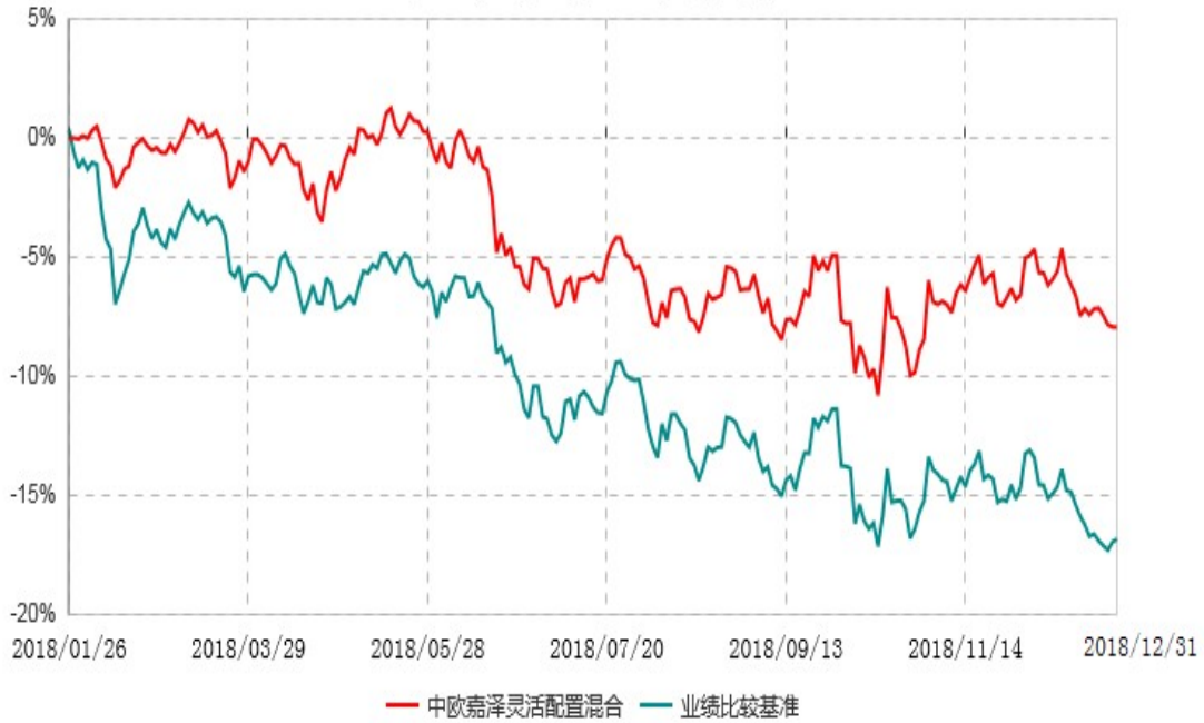
中欧嘉泽灵活配置混合型证券投资基金累计净值增长率与业绩比较基准收益率历史走势对比图 (2018年01月26日-2018年12月31日)

注：本基金基金合同生效日期为 2018 年 1 月 26 日，自基金合同生效日起到本报告期末不满一年，按基金合同的规定，本基金自基金合同生效起六个月为建仓期，建仓期结束时各项资产配置比例已符合基金合同约定。