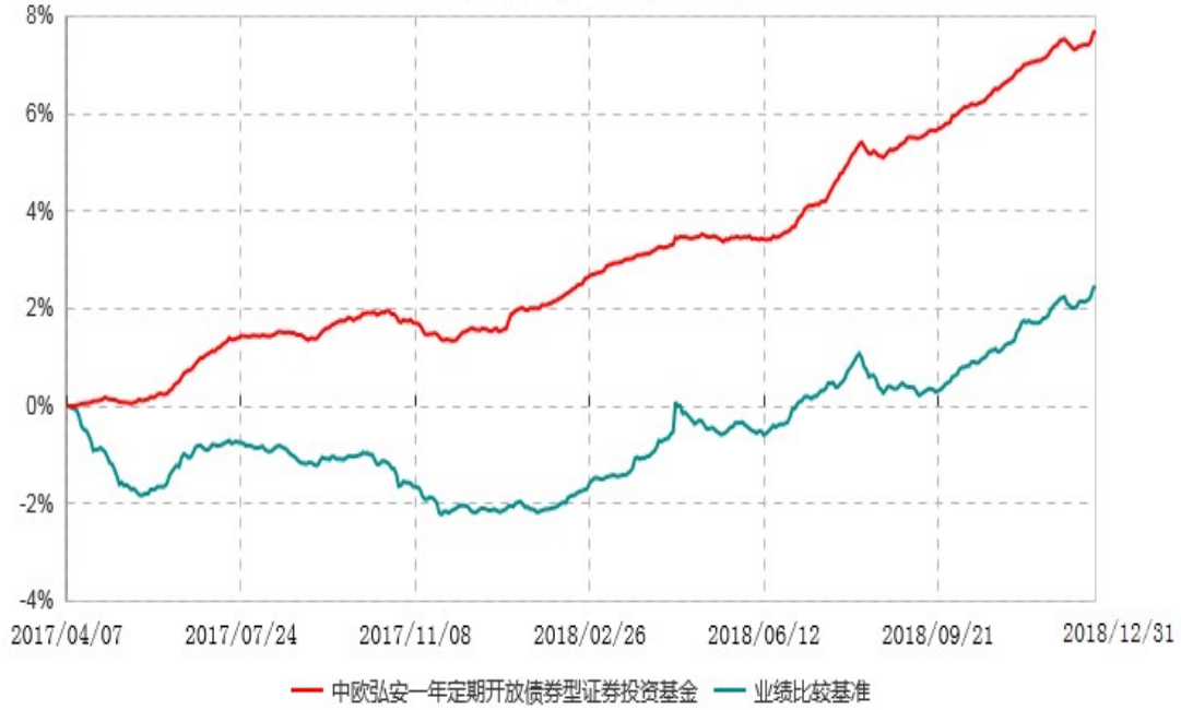
中欧弘安一年定期开放债券型证券投资基金累计净值增长率与业绩比较基准收益率历史走势对比图 (2017年04月07日-2018年12月31日)