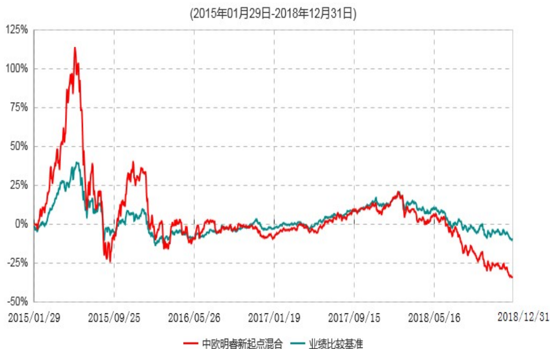
中欧明睿新起点混合型证券投资基金累计净值增长率与业绩比较基准收益率历史走势对比图