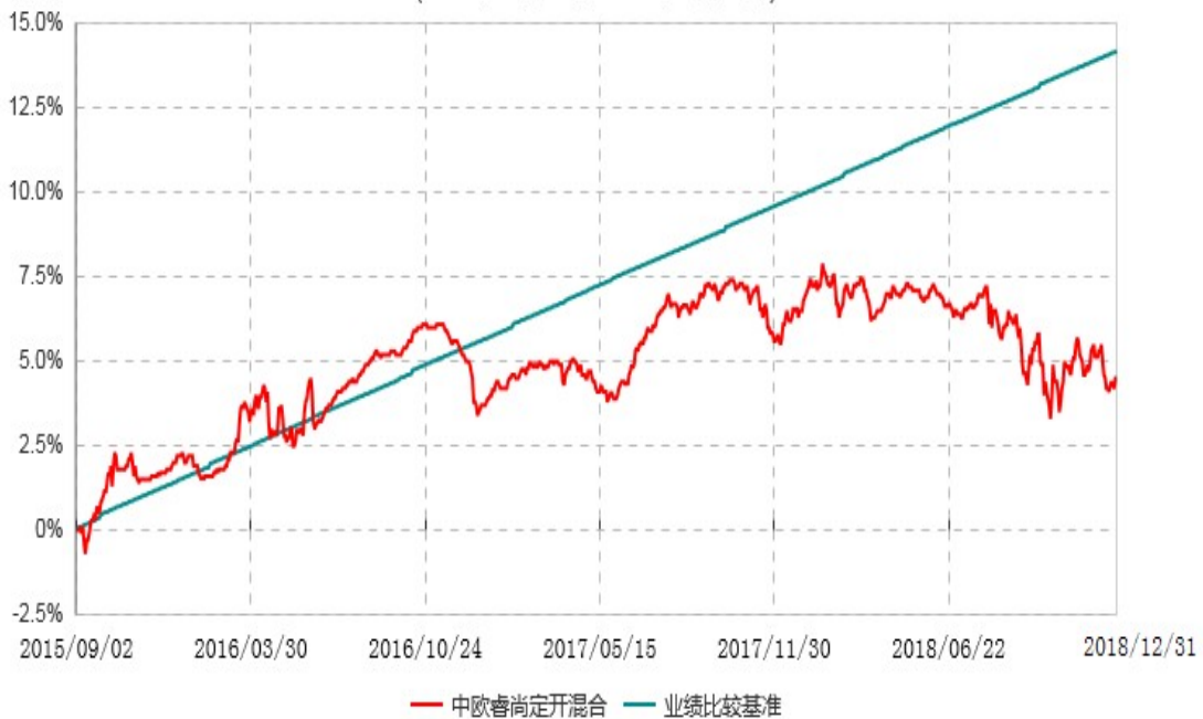
中欧睿尚定期开放混合型发起式证券投资基金累计净值增长率与业绩比较基准收益率历史走势对比图 (2015年09月02日-2018年12月31日)