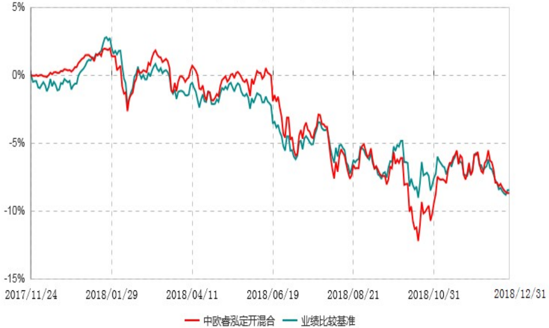
中欧睿泓定期开放灵活配置混合型证券投资基金累计净值增长率与业绩比较基准收益率历史走势对比图 (2017年11月24日-2018年12月31日)

注：本基金基金合同生效日期为 2017 年 11 月 24 日，按基金合同的规定，本基金自基金合同生效起六个月为建仓期，建仓期结束时各项资产配置比例已符合基金合同约定。