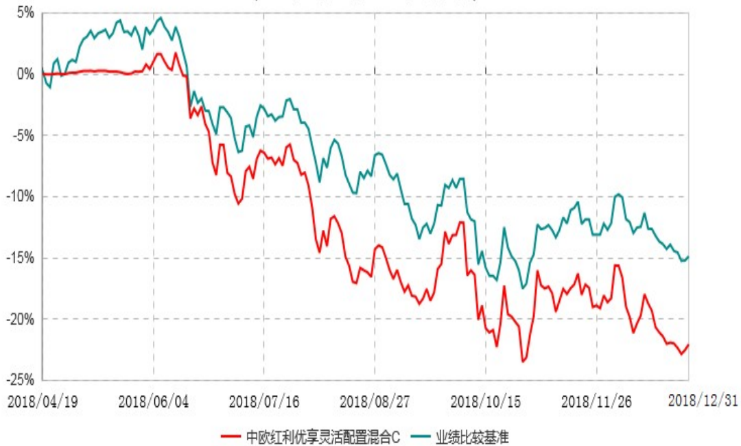
中欧红利优享灵活配置混合C累计净值增长率与业绩比较基准收益率历史走势对比图 (2018年04月19日-2018年12月31日)

注：本基金基金合同生效日期为 2018 年 4 月 19 日，自基金合同生效日起到本报告期末不满一年，按基金合同的规定，本基金自基金合同生效起六个月为建仓期，建仓期结束时各项资产配置比例已符合基金合同约定。