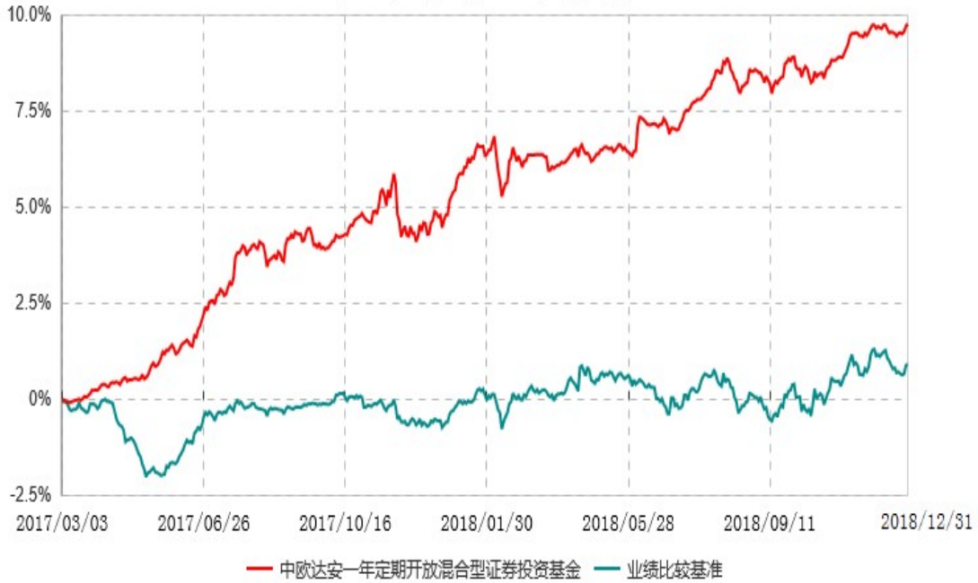
中欧达安一年定期开放混合型证券投资基金累计净值增长率与业绩比较基准收益率历史走势对比图 (2017年03月03日-2018年12月31日)