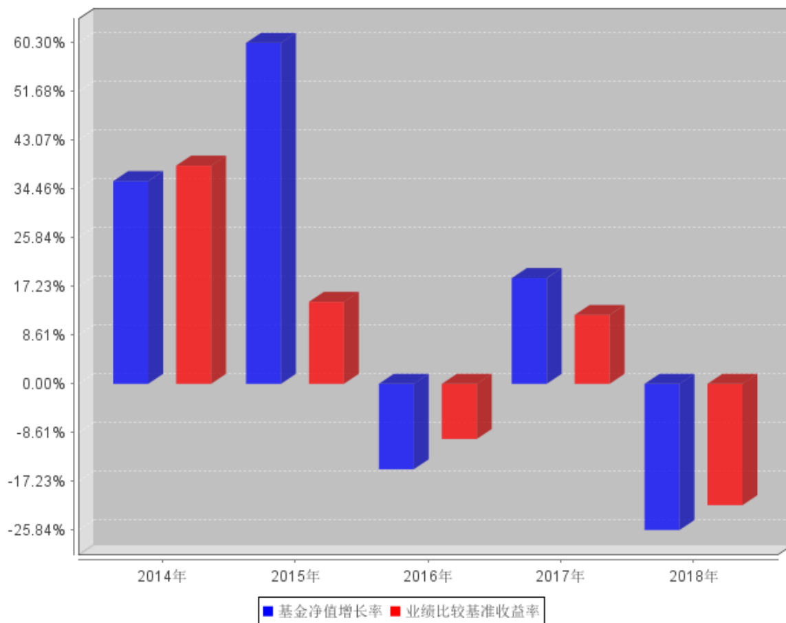
过去五年基金每年净值增长率及其与同期业绩比较基准收益率的对比图