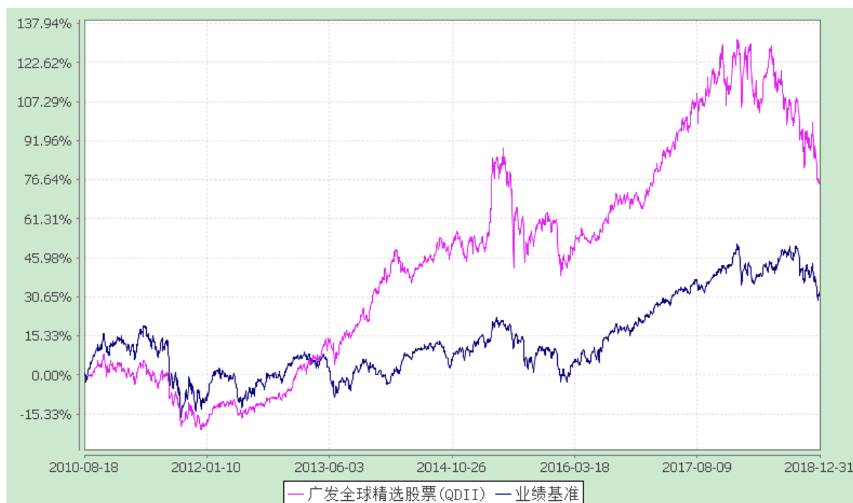
广发全球精选股票型证券投资基金 份额累计净值增长率与业绩比较基准收益率历史走势对比图 (2010 年 8 月 18 日至 2018 年 12 月 31 日)

注：本基金自 2014 年 6 月 10 日起，将基金业绩比较基准由“摩根士丹利综合亚太（除日本）总收益指数”变更为“60%×MSCI 全球指数（MSCI World Index）+40%×恒生指数”。