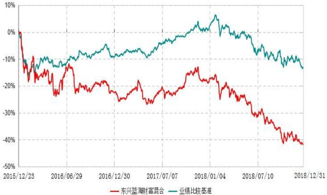
东兴蓝海财富灵活配置混合型证券投资基金累计净值增长率与业绩比较基准收益率历史走势对比图 (2015年12月23日-2018年12月31日)