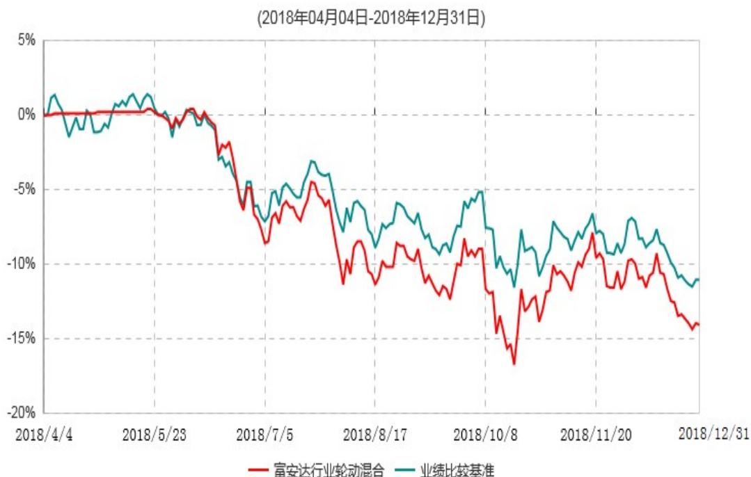
富安达行业轮动灵活配置混合型证券投资基金累计净值增长率与业绩比较基准收益率历史走势对比图

根据《富安达行业轮动灵活配置混合型证券投资基金基金合同》规定,本基金建仓期为6个月,建仓截止日为2018年10月4日。建仓期结束时本基金各项资产配置比例符合本基金合同规定的比例限制及投资组合的比例范围。