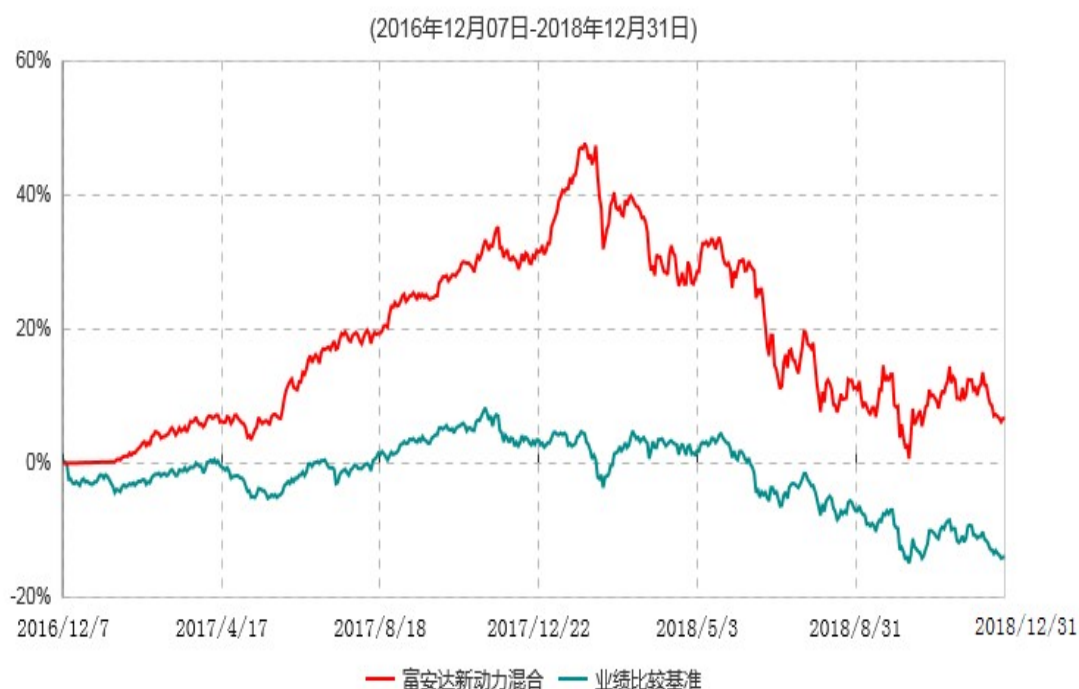
富安达新动力灵活配置混合型证券投资基金累计净值增长率与业绩比较基准收益率历史走势对比图

根据《富安达新动力灵活配置混合型证券投资基金基金合同》规定，本基金建仓期为6个月，建仓截止日为2017年6月7日。建仓期结束时本基金各项资产配置比例符合本基金合同规定的比例限制及投资组合的比例范围。