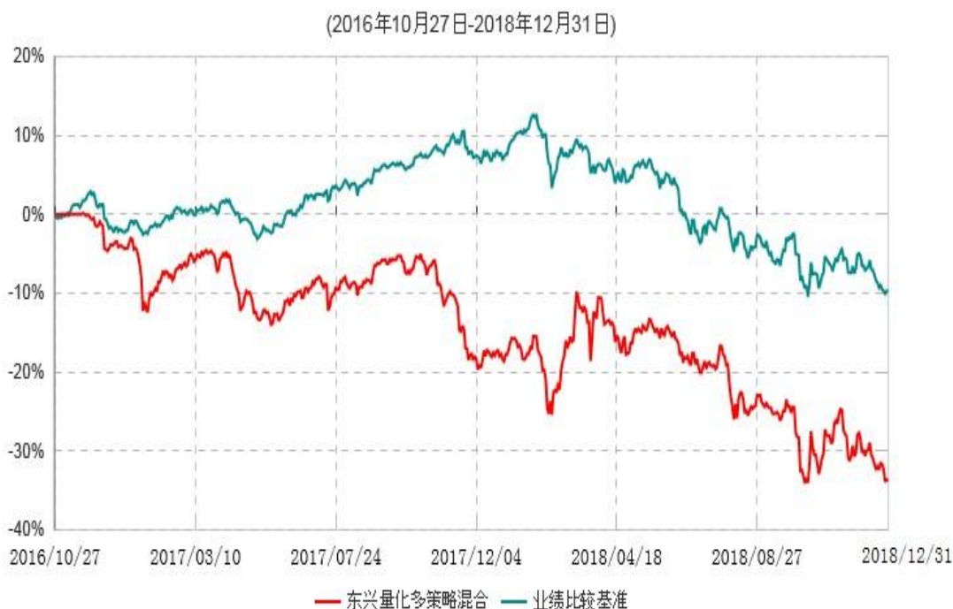
东兴量化多策略灵活配置混合型证券投资基金累计净值增长率与业绩比较基准收益率历史走势对比图

注：1、本基金基金合同生效日为2016年10月27日，根据相关法律法规和基金合同，本基金建仓期为基金合同生效之日起6个月内；