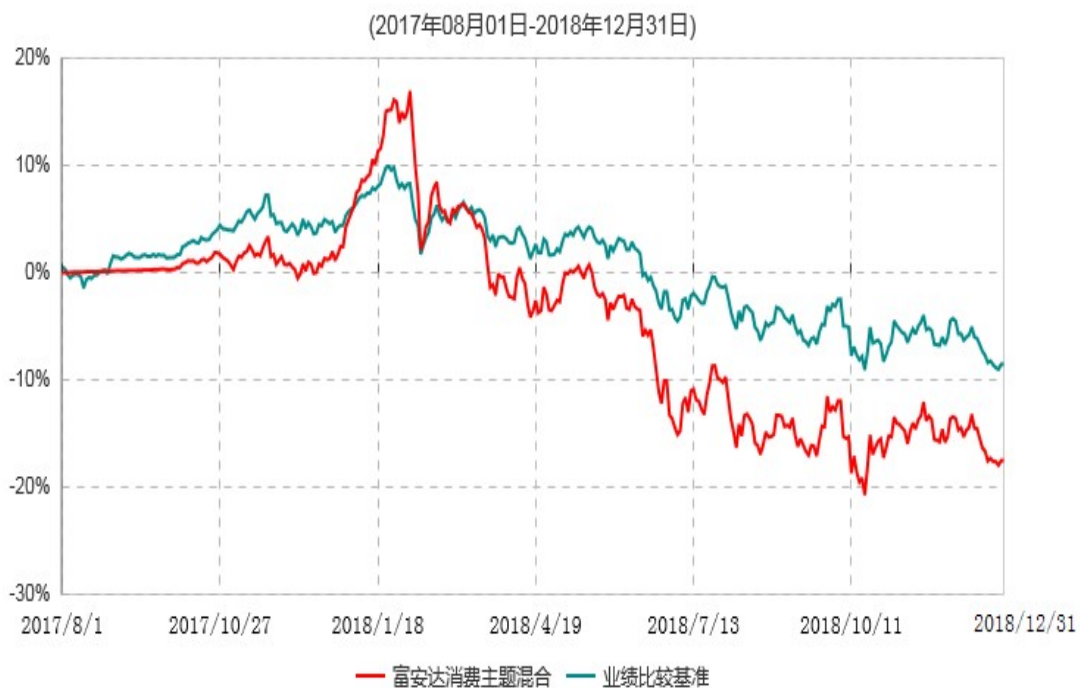
富安达消费主题灵活配置混合型证券投资基金累计净值增长率与业绩比较基准收益率历史走势对比图

本基金于2017年8月1日成立，根据《富安达消费主题灵活配置混合型证券投资基金基金合同》规定，本基金建仓期为6个月，建仓截止日为2018年1月31日。建仓期结束时本基金各项资产配置比例符合本基金合同规定的比例限制及投资组合的比例范围。