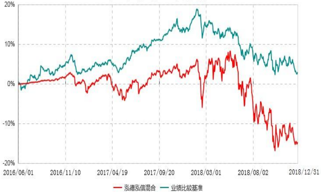
泓德泓信灵活配置混合型证券投资基金累计净值增长率与业绩比较基准收益率历史走势对比图 (2016年06月01日-2018年12月31日)

注：根据基金合同的约定，本基金建仓期为6个月，截至报告期末，本基金的各项投资比例符合基金合同关于投资范围及投资限制规定。