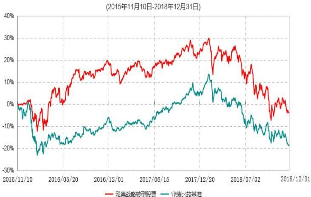
泓德战略转型股票型证券投资基金累计净值增长率与业绩比较基准收益率历史走势对比图

注：根据基金合同的约定，本基金建仓期为6个月，截至报告期末，本基金的各项投资比例符合基金合同关于投资范围及投资限制规定。