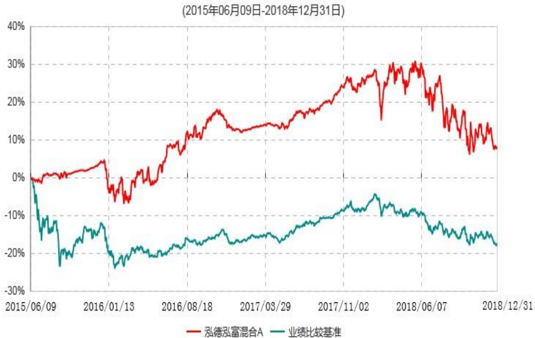
泓德泓富混合A累计净值增长率与业绩比较基准收益率历史走势对比图