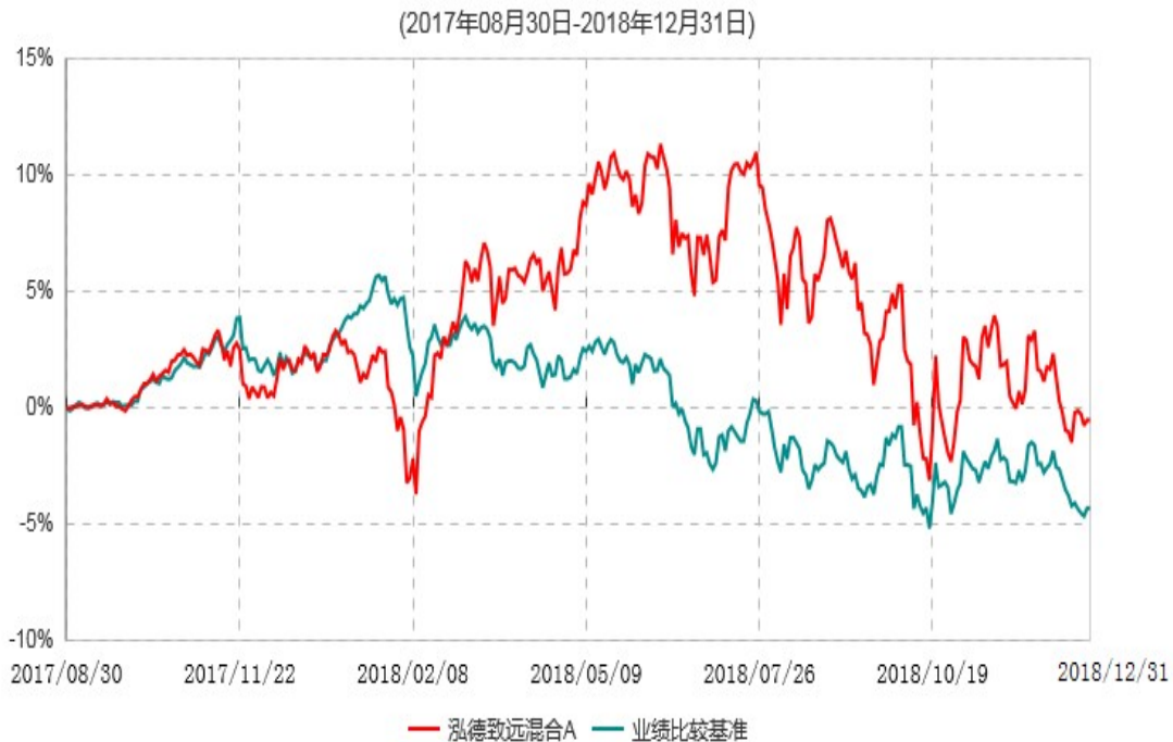
泓德致远混合A累计净值增长率与业绩比较基准收益率历史走势对比图