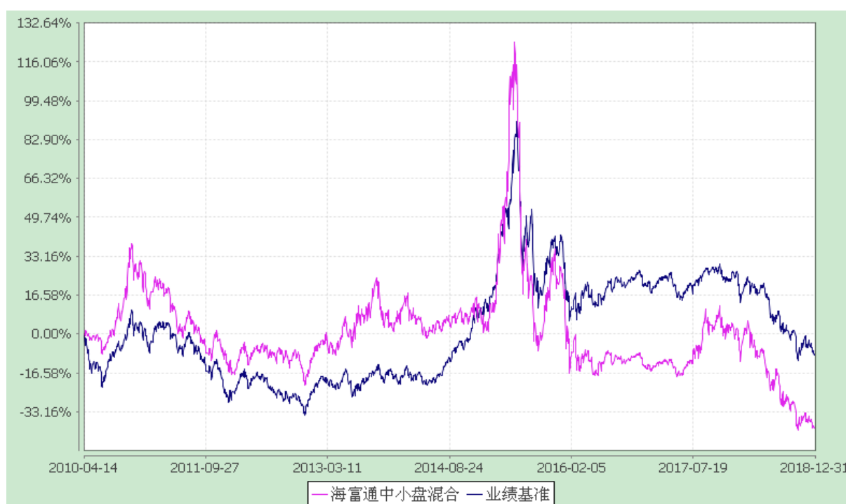
海富通中小盘混合型证券投资基金 份额累计净值增长率与业绩比较基准收益率的历史走势对比图 (2010年4月14日至2018年12月31日)

注：按照本基金合同规定，本基金建仓期为基金合同生效之日起六个月。建仓期满至今，本基金投资组合均达到本基金合同第十一条（二）、（五）规定的比例限制及本基金投资组合的比例范围。