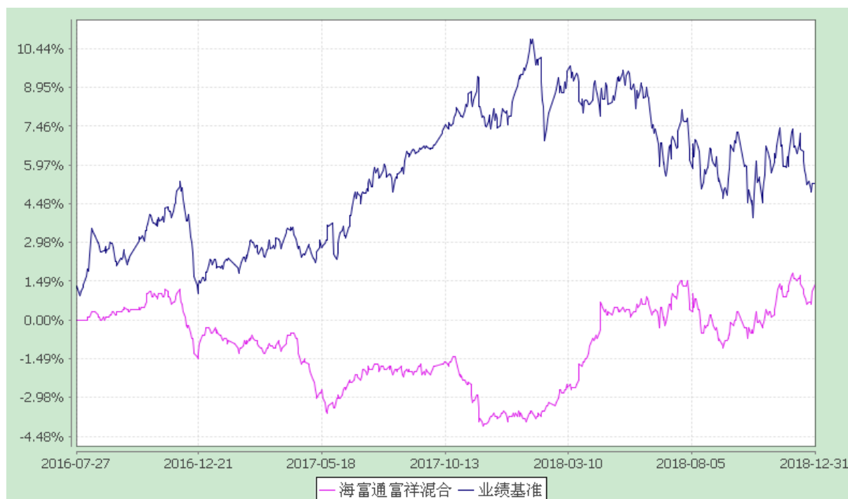
海富通富祥混合型证券投资基金 份额累计净值增长率与业绩比较基准收益率的历史走势对比图 (2016 年 7 月 27 日至 2018 年 12 月 31 日)

注：本基金合同于 2016 年 7 月 27 日生效，按基金合同规定，本基金自基金合同生效起 6 个月内为建仓期。建仓期结束时本基金的各项投资比例已达到基金合同第十二部分（二）投资范围、（四）投资限制中规定的各项比例。